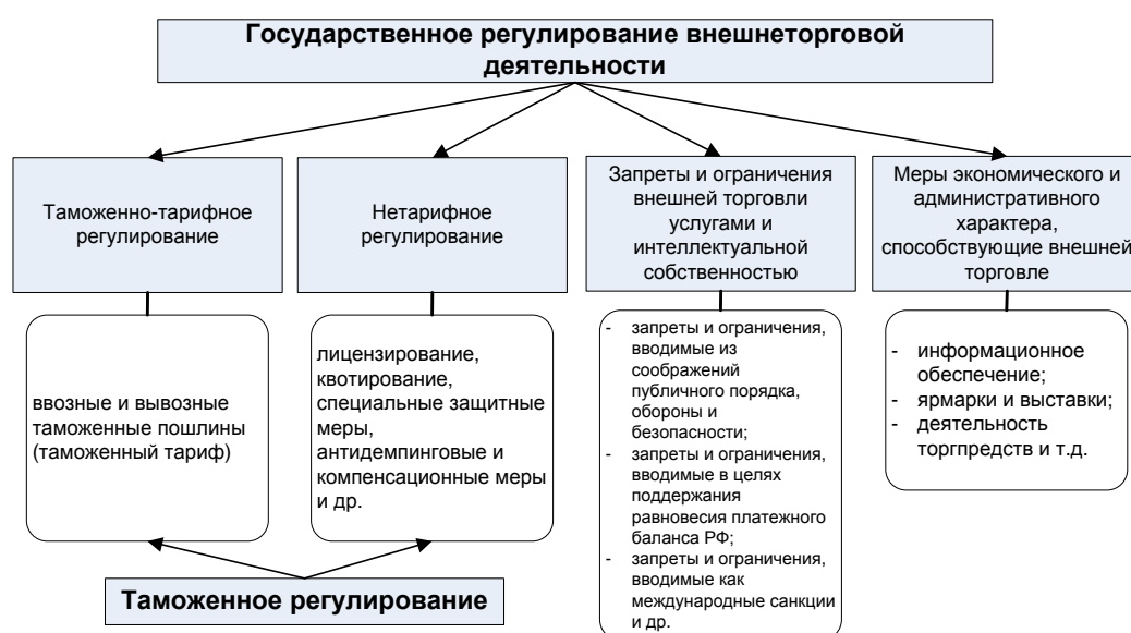
Схема 3. Соотношение государственного регулирования внешнеторговой деятельности и таможенного регулирования в Российской Федерации

В настоящее время нетарифные меры в Российской Федерации применяются одновременно по двум направлениям: через каналы внешнеторгового регулирования , нормативной базой которого является Федеральный закон «Об основах государственного регулирования внешнеторговой деятельности», закрепивший систему нетарифных мер, и таможенного регулирования , с помощью которого дифференцируется применение нетарифных мер в зависимости от выбранного таможенного режима (схема 3). На практике наличие организационных и нормативных «нестыковок» между внешнеторговым и таможенным регулированием негативно сказывается на результативности применения нетарифных мер.